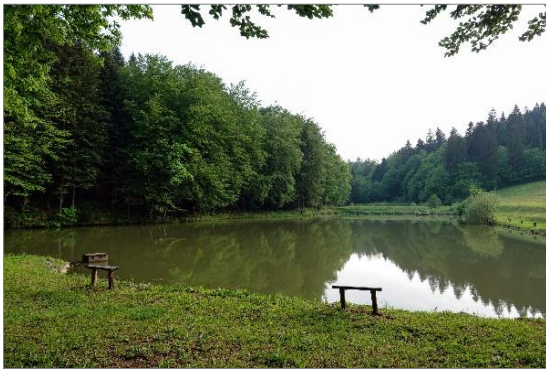
Slika 7: ribniki spomladi

Ob ribnikih tako občasno posedajo ribiči, ki se ukvarjajo z ribolovom, na sprehode pa v ta del zahajajo tudi domačini.