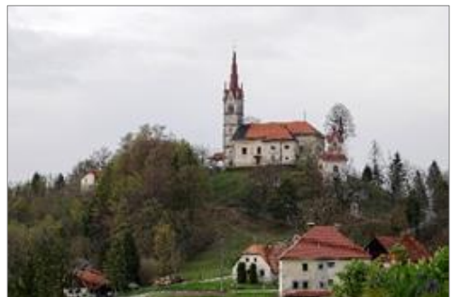
Slika 4: Žalostna gora

V občini so tudi sedeži treh tovarn: M Tom, Sep in Dorema, poleg tega so v kraju tudi pošta, Kmetijska zadruga, knjižnica, kulturni dom, zavarovalnica.