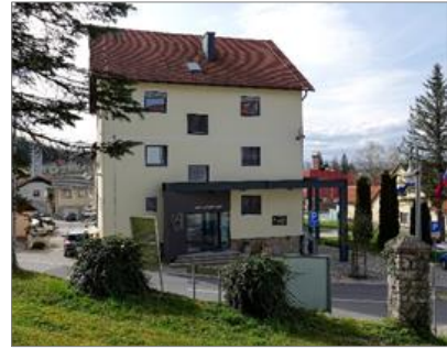
Slika 1: Upravno-kulturni center

Občina ima nekaj več kot 3100 prebivalcev. Ustanovljena je bila 1. januarja 2007, njen župan pa je že od njene ustanovitve gospod Anton Maver. V občini je ena osnovna šola, to je Osnovna šola Mokronog s podružnično šolo Trebelno, in Vrtec Mokronožci.