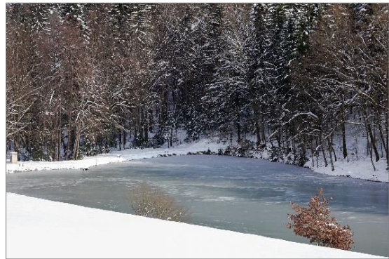
Slika 8: ribniki pozimi

Načrtovana učna pot ni rekreacijsko zahtevna, a vseeno zanjo priporočamo pohodno obutev. Pot z ogledi in aktivnostmi traja približno 45 minut.