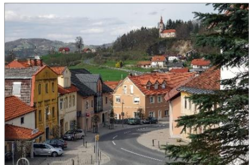
Slika 5: staro trško jedro Mokronoga

Lahko pa, da je bilo malo drugače, da je njegovo visočanstvo sezulo škorenjce in pogumno stopilo po blatu do trške hiše. Ljudem je bilo to tako všeč, da so odtis stopala, s katerim je plemenitost najprej stopila v blato, vzeli za svoj grb, kraj pa krstili za Mokronog.